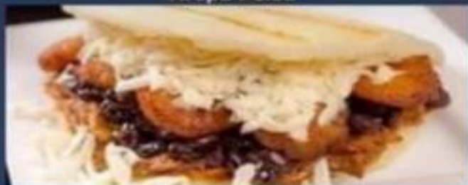
Arepa de Pabellón