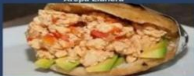
Arepa de Perico