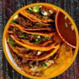
TACOS DE BIRRIA